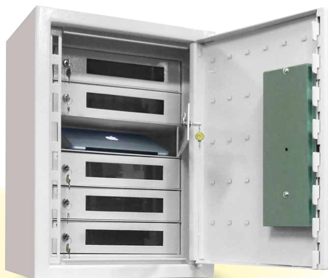
Säkerhetsskåp SK500-6LR Plexi