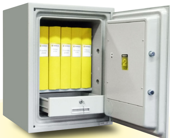
Bankfack SD Pro