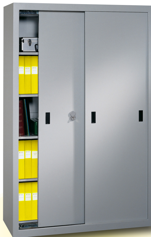
Dokumentskåp SDS 860

Produktnamn: Dokumentskåp SDS 530, SDS 630 SDS 860.