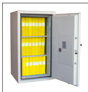
Rymmer 30 A4-pärmar