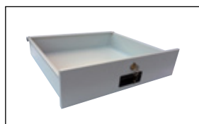
Låda med 2 nycklar