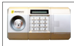
Dubbelt låssystem med både nyckel- och elkodlås

* Innebär att man behöver inte låsa dörren för att den skall hållas stängd. En regel aktiveras vid stängning och alla kolvar skjuts ut och håller dörren tätt tillsluten, vilken borgar för riktig brandsäkerhet.