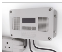
Elcentral smart inlåst på baksidan av vagnen