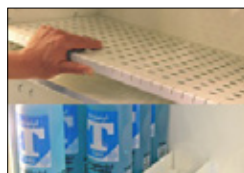
Trådhylla med avskiljare (tillval)