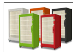
Finns i dessa färger